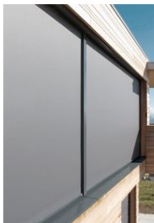
Tende da sole per facciate